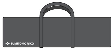
キャリングバッグ