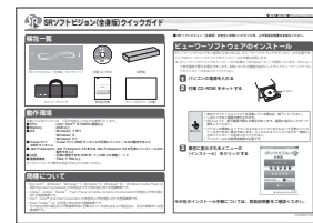
クイックガイド(本書)