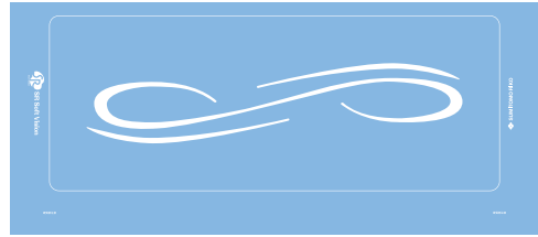
SRソフトビジョン(全身版)(センサシート)